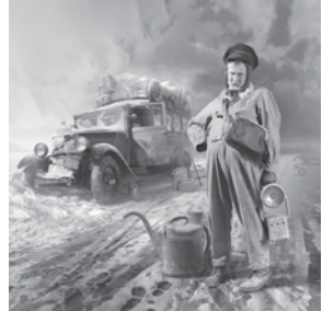
© Michel Lagarde - « L'autobus »