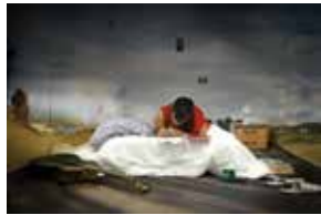
© Brice Bourdet - « Cécilia »