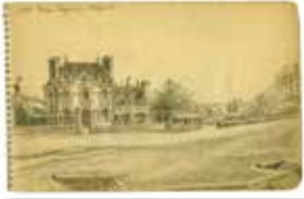
Bourse matériel photo

tous les genres : actualités reconstituées, bandes publicitaires, féeries en couleurs, mélodrames, burlesque, science-fiction, etc. Harma Kirsten directeur du projet vous propose un moment partagé avec la cinéaste Cécile Gueib autour de la vie de Georges Méliès. Extraits de films, biographie et description des techniques de montage de films de Méliès. Harma Kirsten et Michael Vigneron vous feront découvrir les codes de la musique des films muets avec des exemples de musique descriptive, par interprétation des styles et codes musicaux lors d'improvisations en fonction des images. Cette soirée en partenariat avec le Conservatoire Régional du Grand Nancy, accompagne l'exposition de dessins inédits de Georges Méliès, également présentée au C.I.L.