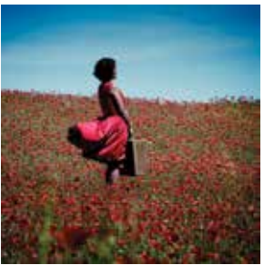
© Pascale Miller « Errance féminine »